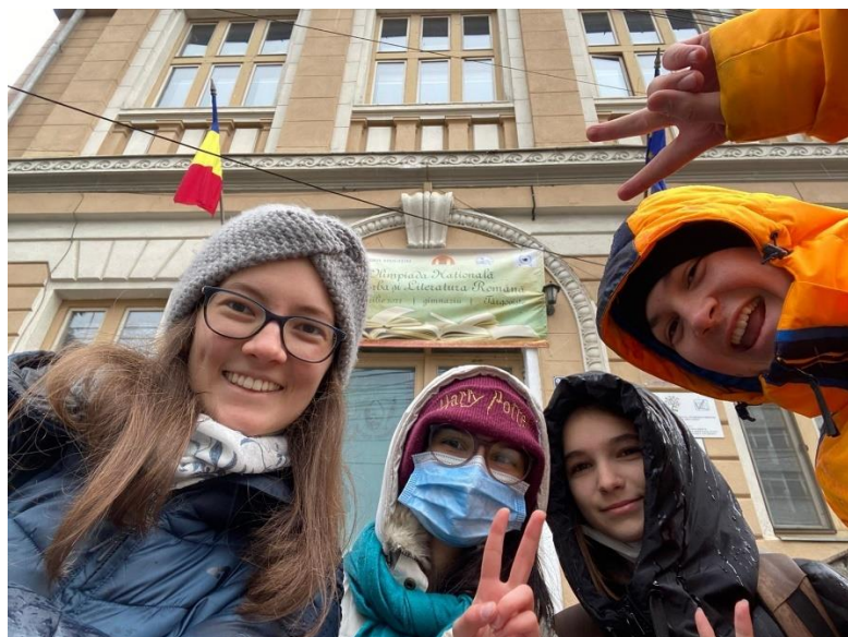
*mi-ascunsesem zâmbetul și de aerul rece, nu doar de obiectivul foto*